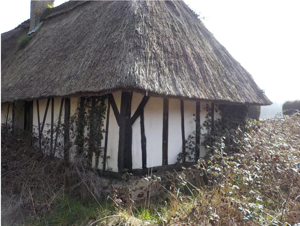
Cotés salle de bain