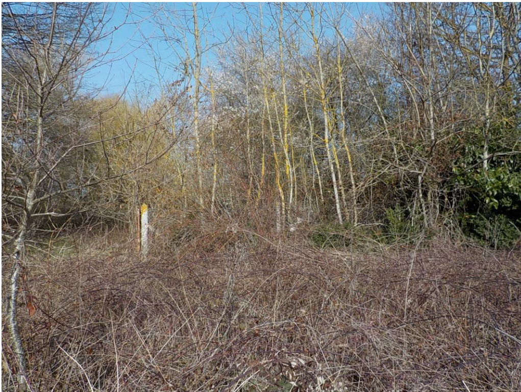
Vue sur le terrain arrière